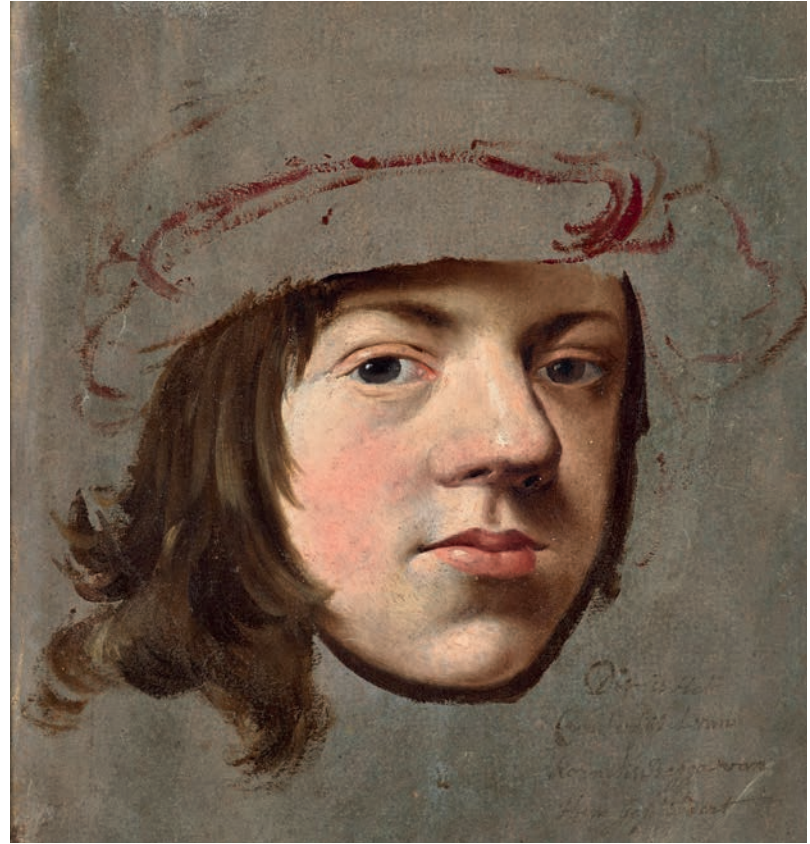
Cornelis Bega, Autorretrato con sombrero .

En los últimos años sus colecciones de fotografía y grabados han crecido significativamente. ¿Cuáles han sido las adquisiciones más interesantes? Principalmente compro fotografías que complementan otras obras de mi colección, desde imágenes de época del siglo XIX de artistas en sus estudios hasta de creadores contemporáneos como Lucien Freud fotografiado por su asistente David Dawson.